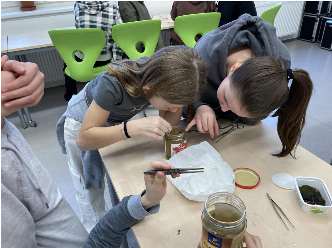
Lovení drobtiny ze vzorků